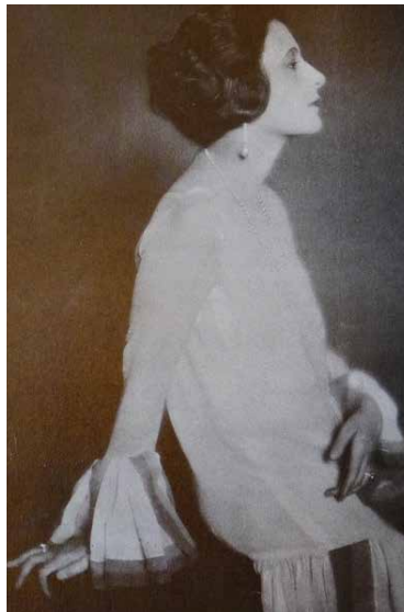
Hansi Burg (1925)