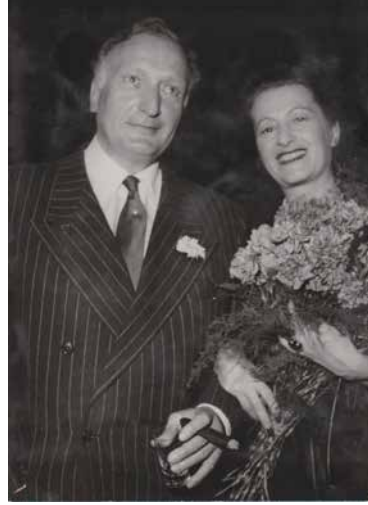
In Zürich bei der Premiere von „Liliom“ (1947)