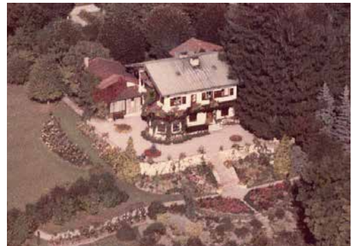
Hans Albers-Villa (zu Lebzeiten Hans Albers und Hansi Burg)