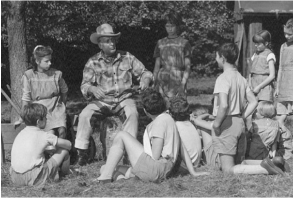
Hans Albers mit Kindern.